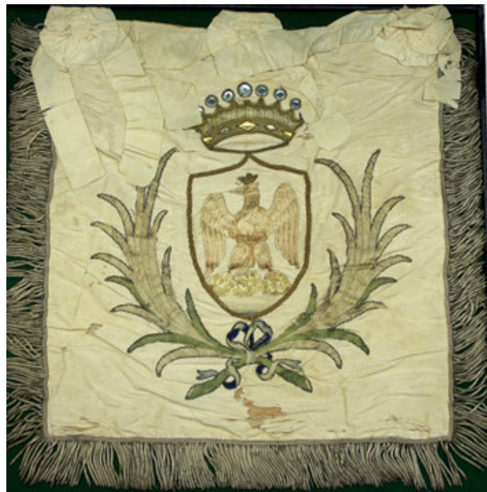
Tablier de trompette huissiers Ville de Nice Anonyme, 1860 ca.

Dès le 1 er avril 1860, des manifestations sont organisées pour l'arrivée des premières troupes impériales françaises. Le 3 avril 1860, le 2 e bataillon de ligne fait son entrée dans Nice sous les acclamations du public. Durant l'après-midi, sur la place Masséna, une foule accompagnée par un orchestre d'harmonie reprend en chœur très symboliquement L'air de la Reine Hortense attribuée à Hortense de Beauharnais. L'air connut un réel succès au XIX e siècle, sous Napoléon Bonaparte bien sûr, mais également pendant la Restauration et le Second Empire, où il devint quasiment un hymne national. Le public suivra, jour après jour, le programme de ces festivités ; lesquelles s'achèveront, en point d'orgue, par la visite à Nice de l'empereur Napoléon III en septembre 1860.