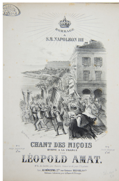
Chant des Niçois Hymne à la France Léopold Amat 1860 Bibliothèque du Chevalier de Cessole