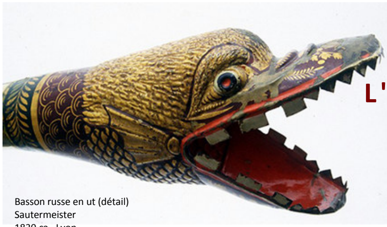
Basson russe en ut (détail) Sautermeister 1830 ca, Lyon Collection instrumentale du Palais Lascaris