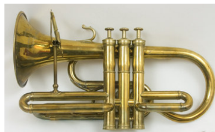
Cornet à piston type Périnet Adolphe Sax, 1869, Paris Collection instrumentale du Palais Lascaris